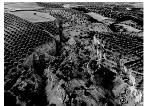
Foto del dueño de un campo en Turquía separado por los terremotos del 6 de febrero. La grieta de la izquierda tiene 30 metros de profundidad y 200 metros de ancho.